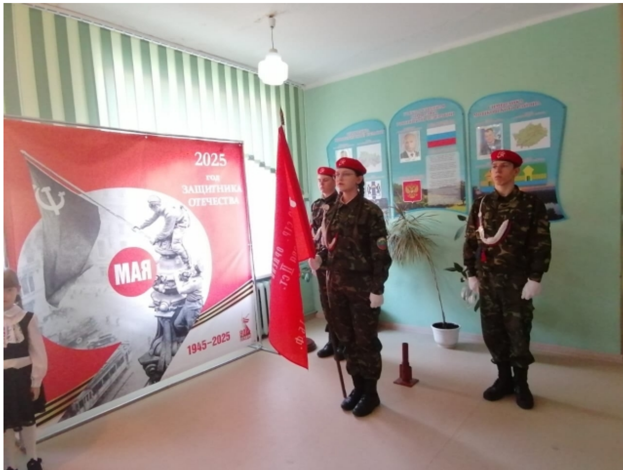
«Часовой у знамени Победы»